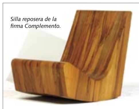
Silla reposera de la firma Complemento.

a 41 escultores, artistas, diseñadores, arquitectos, fabricantes de muebles, artesanos y otros profesionales de la madera, provenientes de las ciudades de La Paz, Cochabamba y Santa Cruz; cuyo único requisito de participación fue su serio compromiso con la causa del Proyecto. No obstante, a raíz del éxito de la invitación, un total de 65 participantes acudieron a esta cita ecológica.