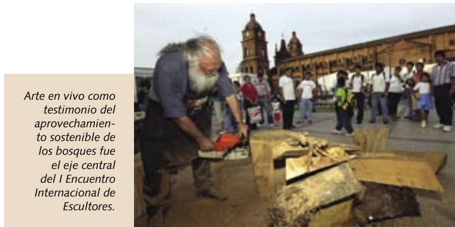
Arte en vivo como testimonio del aprovechamiento sostenible de los bosques fue el eje central del I Encuentro Internacional de Escultores.