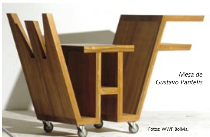
Mesa de Gustavo Pantelis