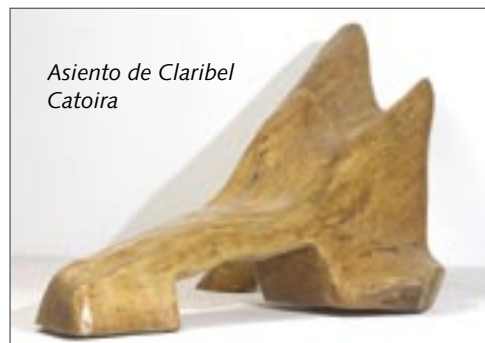
Asiento de Claribel Catoira