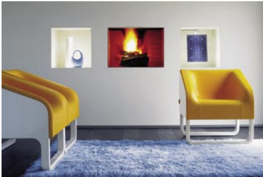
'Duna': Poltrona para admirar y lucir: perfecta fusión entre la madera, el poliuretano y la tela elástica, en un mueble de suaves contornos. Contemporaneidad en toda su dimensión.

o en un set de televisión; siendo esta cualidad el mayor aporte de este profesional al diseño actual.