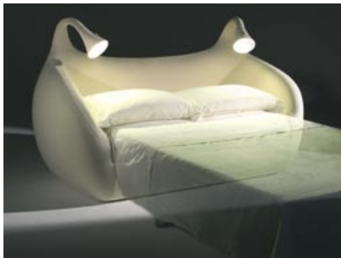
Diseñada para Domodinamica, al lado de su tutor Stefano Giovannoni, 'Morfeo', recrea el ambiente íntimo" de un juego de alcoba: Una cama y las lámparas ubicadas en las mesas de noche. Aquí, tres funciones: sofá, cama y fuente de luz flexible gracias a su sistema de lámparas ubicadas en los extremos del sofá.