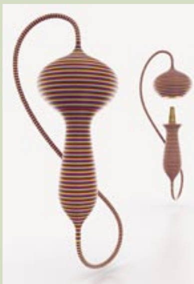
'Koka'. Añoranza, niñez, alegría, tradición, Colombia. Es la "memoria colectiva presente en el juego de la coca, olvidado y suplantado por nuevas tecnologías, carentes de historia y corazón". Cuerpo elaborado en madera y revestido con cordón de hilo, cuero o fibras plásticas entrelazadas; para un juego o un adorno fuerte en imagen y en memoria.