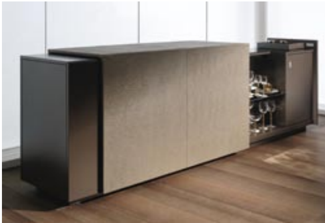
Butler Room Divider. Diseñador, Simon Meter Hödlmoser.