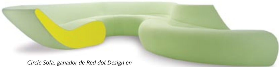
Circle Sofa, ganador de Red dot Design en 2006 en la Categoría 'lo Mejor de lo Mejor' en diseño de producto.

Conocimiento, investigación, armonía, servicio son algunos de valores que se premian en el Red dot Design Award, un prestigioso concurso europeo que, desde hace 52 años, galardona lo mejor del arte y el diseño mundial.